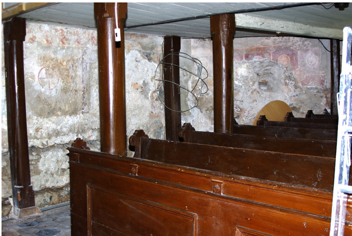
Severná stena presbytéria pod emporou po odkryve.