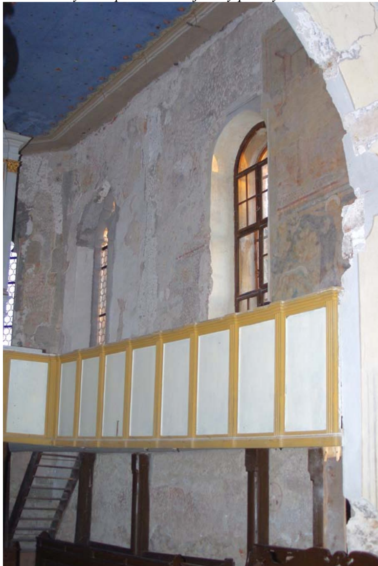
Pohľad na južnú stenu presbytéria po odkryve a rekonštrukcii gotických okien.