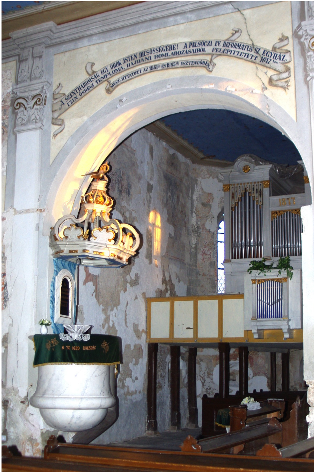
Severná stena presbytéria po tmelení v roku 2016. Pohľad z lode.