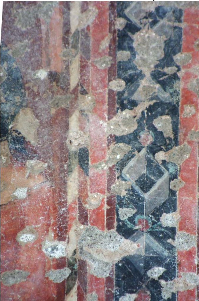
Detail s bordúrou výjavu.