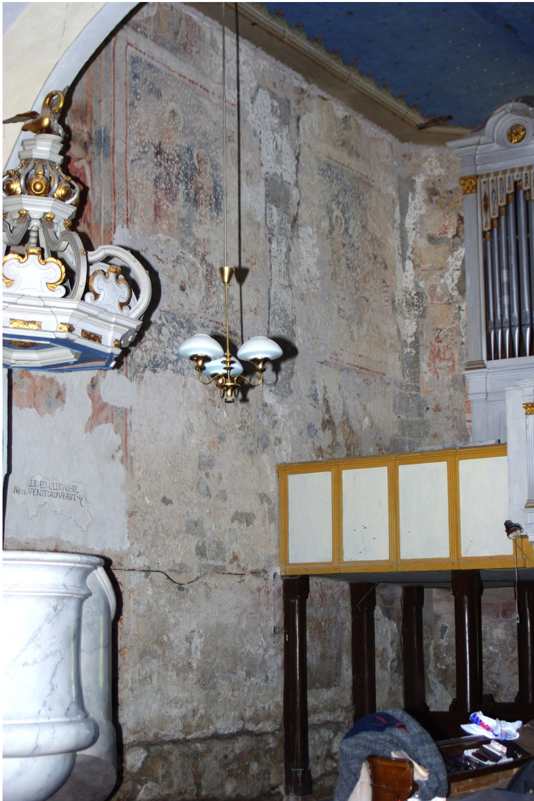
Pohľad na severnú stenu presbytéria po odkryve. Pohľad z lode.