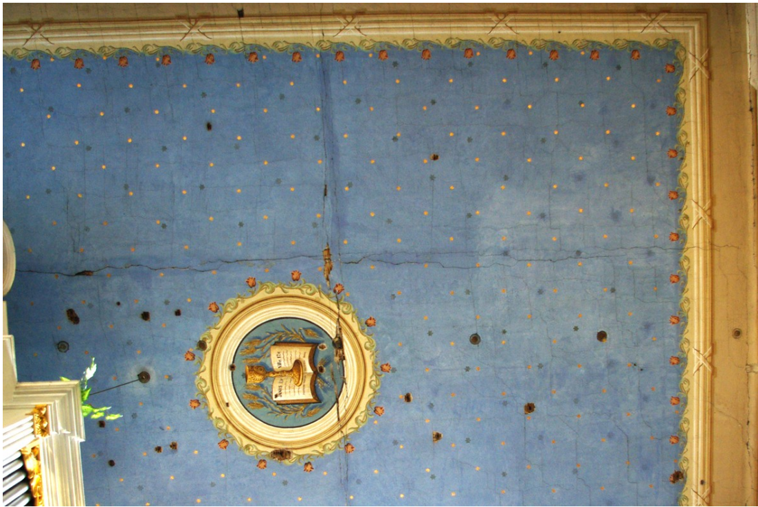
Pohľad na strop presbytéria.