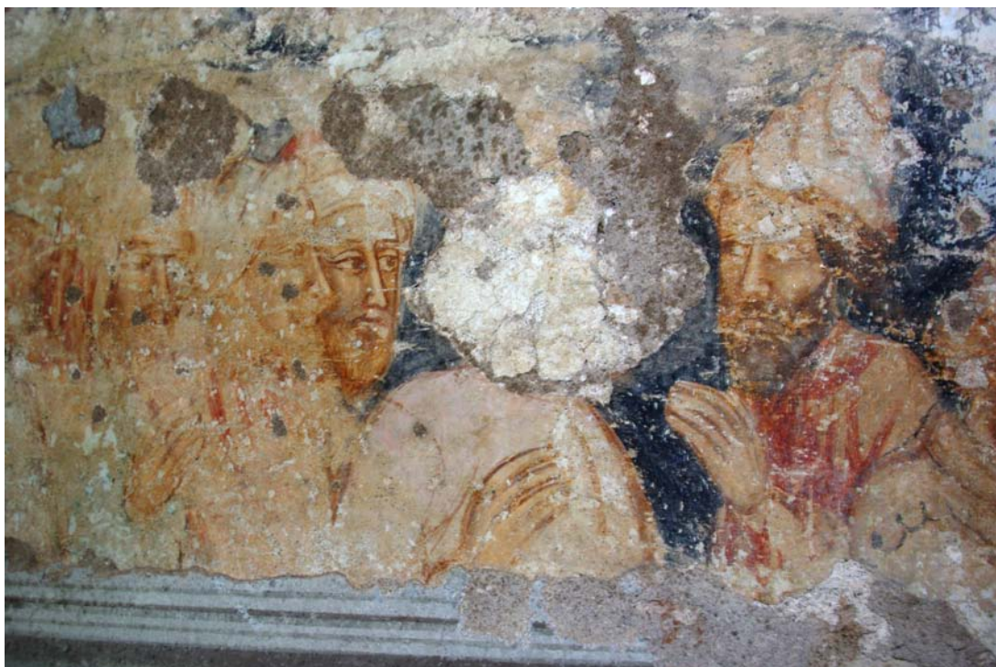
Výjav na severnej stene lode pod stropom odkrytý v prieskumnej sonde v roku 2016