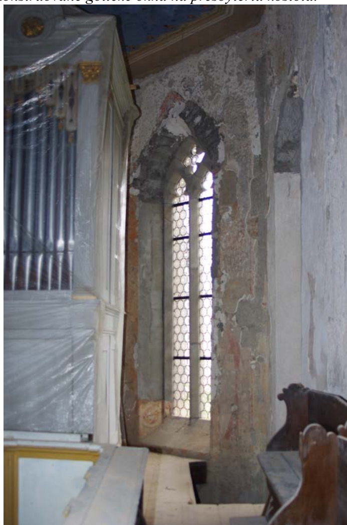
Juhovýchodné okno presbytéria po rekonštrukcii v roku 2015.