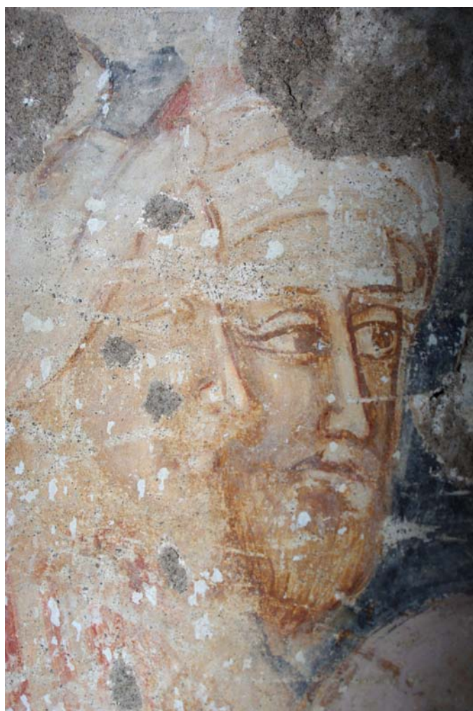
Detail s tvármi starcov z identického výjavu.