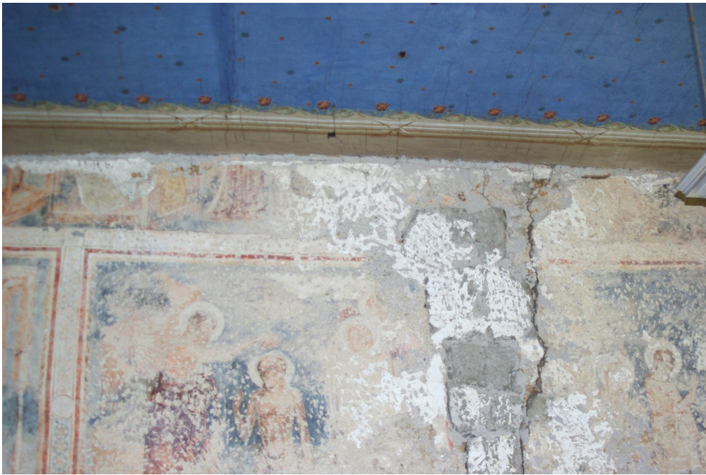
Styk stropu a severnej steny presbytéria.