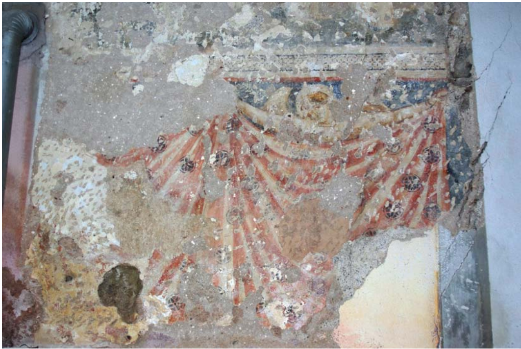
Anjel držiaci lambrekýn. Freska tvorila v minulosti pozadie plastiky. Odkryv na čelnej stene lode realizovaný v roku 2016.