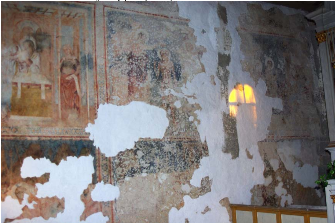
Časť severnej steny presbytéria po tmelení v roku 2016.