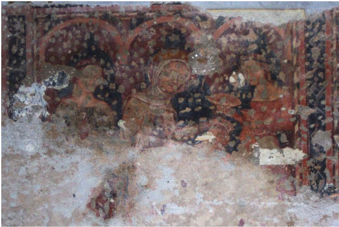
Sv. Alžbeta s dvornými dámami na nástennej maľbe na severnej stene lode v prieskumnej sonde realizovanej v roku 2016.