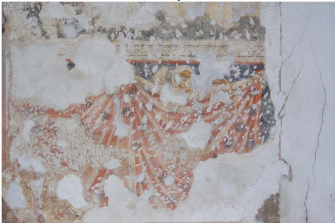
Odkrytá stredoveká freska s anjelom po upevnení a tmelení v roku 2016.