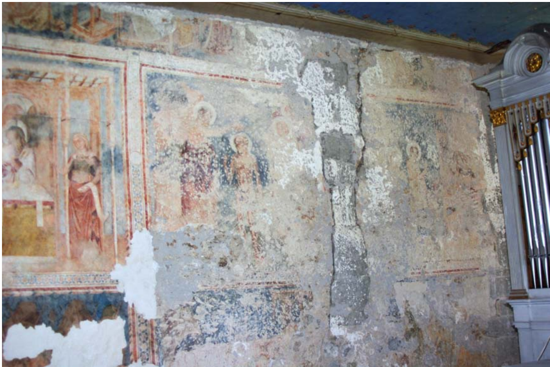
Časť severnej steny presbytéria pred tmelením v roku 2016.