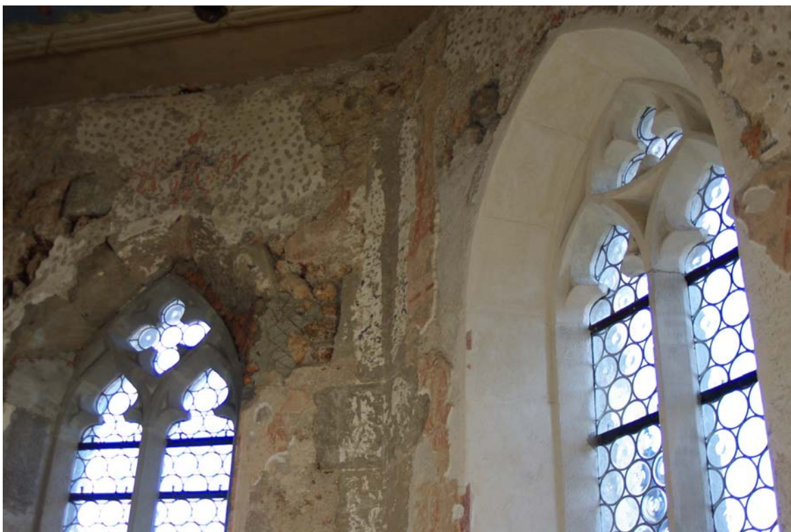
Rekonštruované gotické okná na presbytériu kostola.