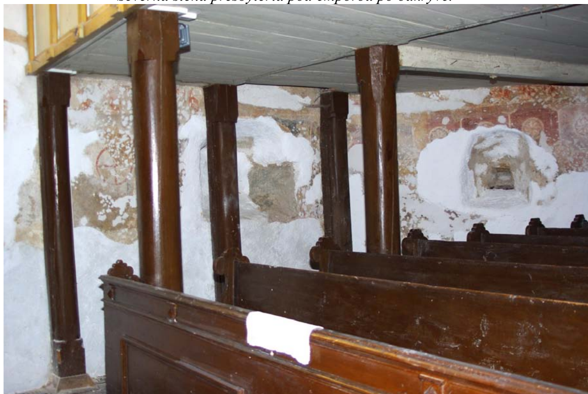
Severná stena presbytéria pod emporou po tmelení v roku 2016. Odprezentované strielne z obdobia pred rokom 1558.