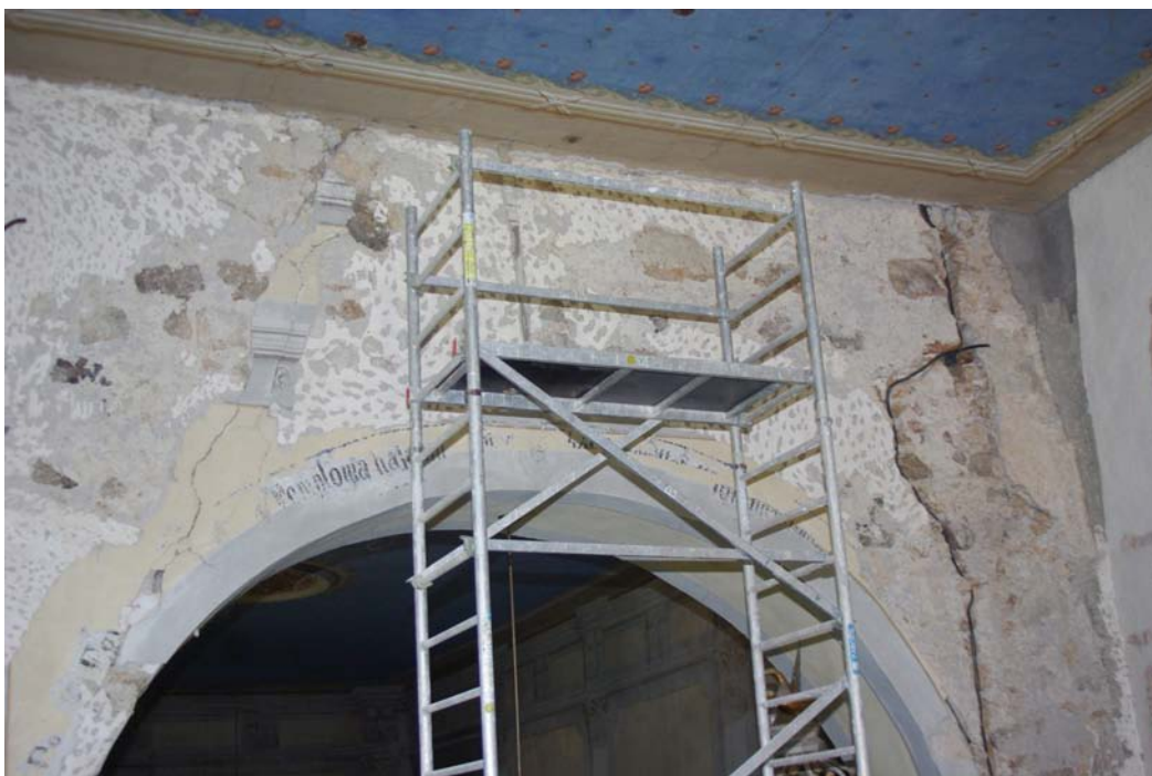
Pohľad na víťazný oblúk zo strany svätyne po odstránení novodobých omietok a malieb.