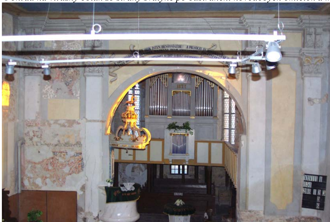
Pohľad na východnú stenu lode po inštalovaní funkčného osvetlenia. Na ľavej strane sú viditeľné veľkoplošné prieskumné sondy, ktoré odryvajú tri stredoveké vrstvy freskovej výzdoby.